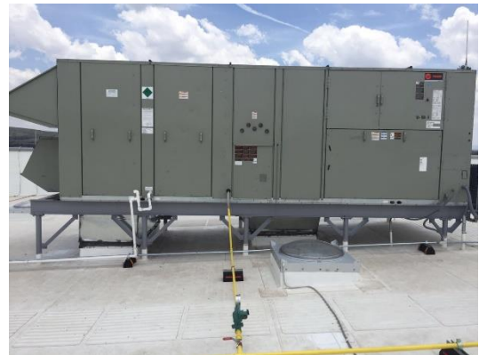
Equipos en Azotea